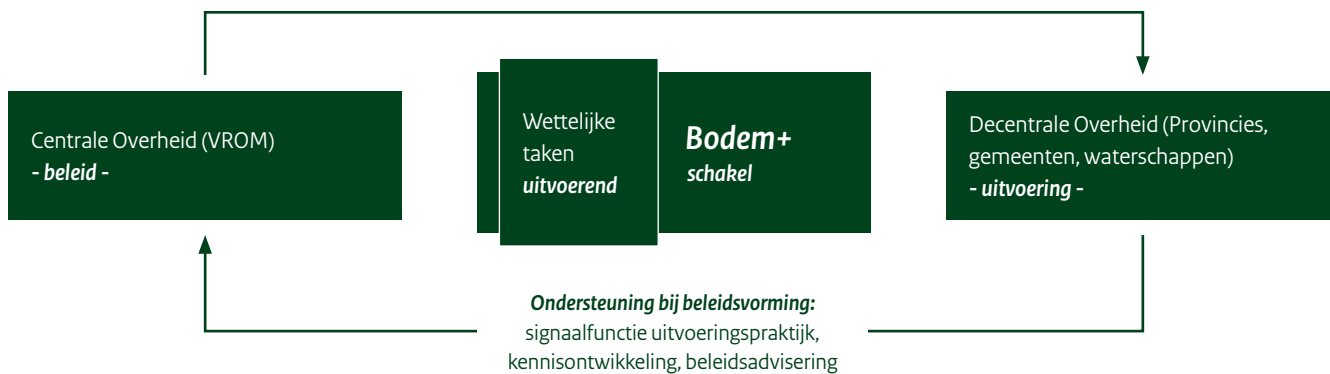
Schematische weergave van de positie van Bodem+ en bijbehorende schakelrol en uitvoerder van wettelijke en centrale (VROM) taken

Ondersteuning bij implementatie en uitvoering: advisering, communicatie, kennisdeling en -verspreiding